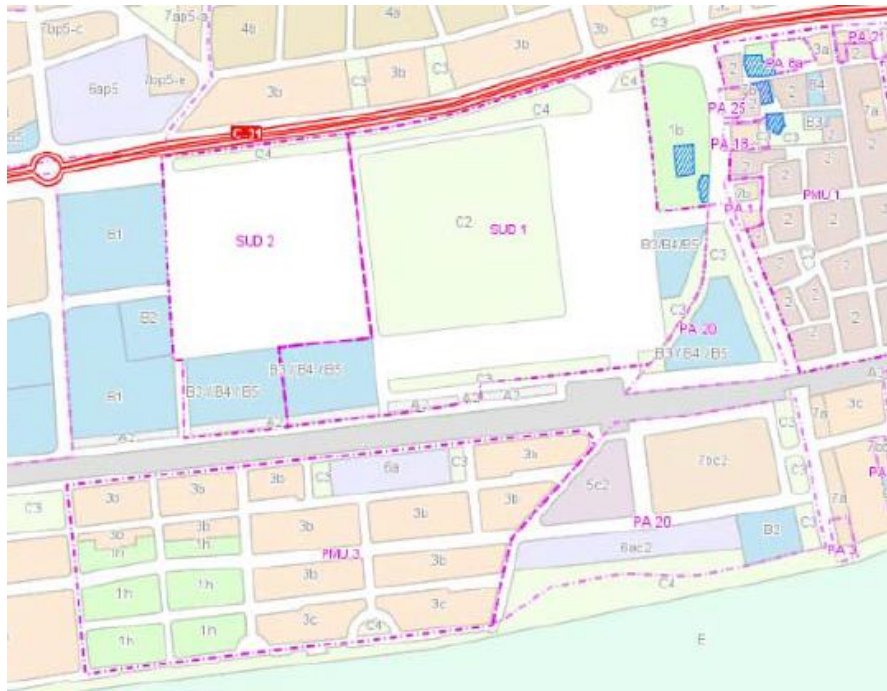
Plana del Castell

Al mateix costat d'aquest terreny trobem dues peces més formen part d'aquest espai que actualment estan pendents d'urbanitzar zones residencials el sector SUD 1 i el sol urbà PA-20, que formen la Plana del Castell, que es un zona de desembocadura de la riera de Cunit i d'aiguamolls i per tant inundable.